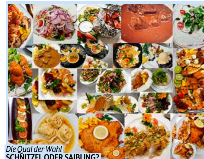
Die Qual der Wahl SCHNITZEL ODER SAIBLING?