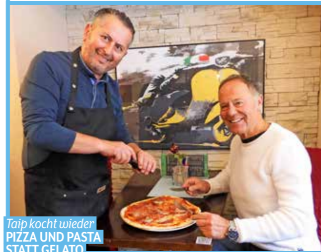
Taip kocht wieder PIZZA UND PASTA STATT GELATO

Burggasse 4, Tel.: 03572/44155 & 0676/9530603 Mo.–Fr. 8–20 Uhr, Sa. & So. 8–14 Uhr