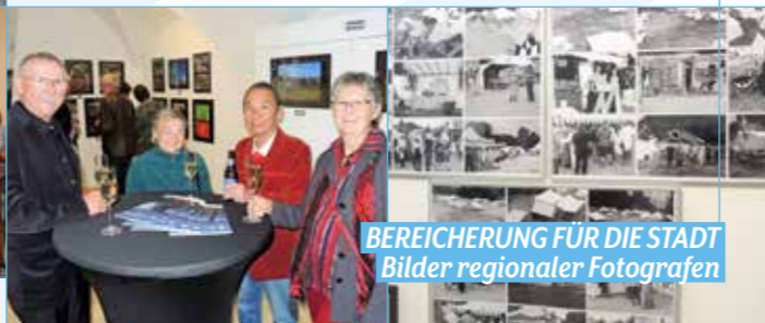
BEREICHUNG FÜR DIE STADT Bilder regionaler Fotografen