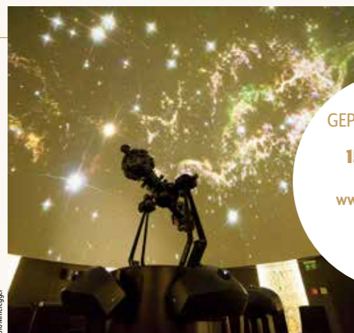
STERNDERL SCHAUEN Das höchste Planetarium der Welt ist mit der allermodernsten Technik ausgestattet. Erforschen Sie den Sternenhimmel!

Weihnachtsferien: täglich geöffnet (außer 1. 1. 2022) Spielplan unter www.sternenturm.at