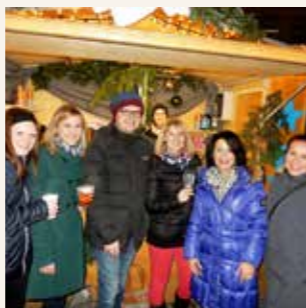
Kulinarik und Kunsthandwerk: Der Christkindlmarkt sorgt mit seinen vielen Standln für Abwechslung.

Bei den Standln am Christkindlmarkt erwartet Sie ein buntes Angebot. Von heißen Getränkekreationen über kulinarische Schmankerl bis hin zu Handwerk und Kunsthandwerk. Ideal, um noch das ein odere andere Weihnachtsgeschenk zu entdecken!