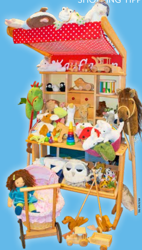
bio, chic & fair