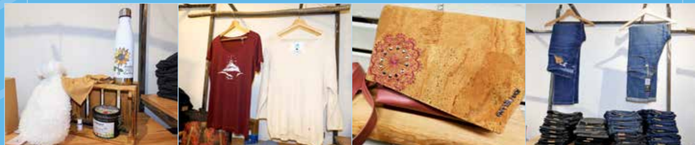
Nachhaltige Mode, Lebensmittel und Accessoires vor Ort kaufen: Dafür steht young nature.

JJW young nature Burggasse 20, T. 0664 1045528, www.young-nature.at