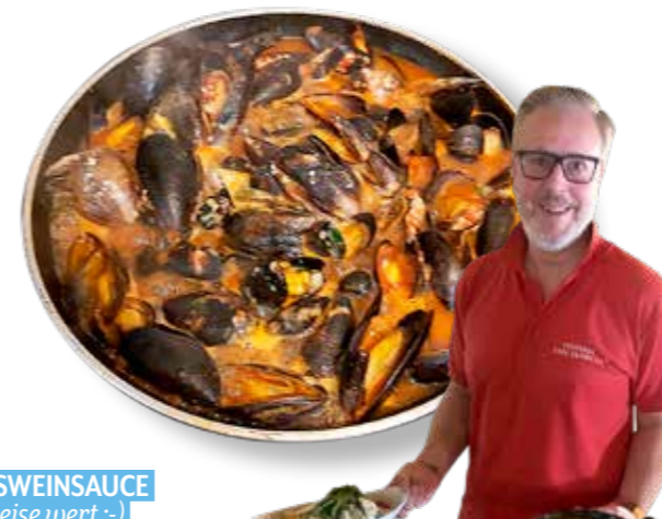
WEISSWEINSAUCE Eine Reise wert! :-)

Weyergasse 1, T. 03572 42200 Mo., Do., Fr. 11–14.30 & 17–22 Uhr, Sa. 11–22 Uhr, So. & Feiertag 11–21 Uhr www.pizzeria-sanmarco.eu