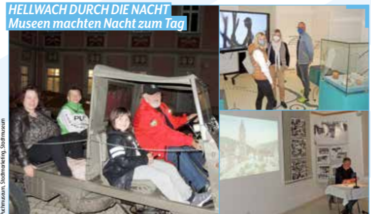
HELLWACH DURCH DIE NACHT Museen machten Nacht zum Tag