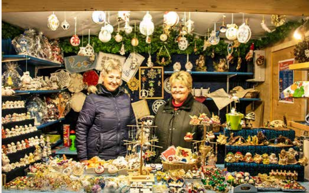
Schöne Geschenksideen: Warum heuer nicht liebevoll hergestelltes Handwerk unter den Baum legen?