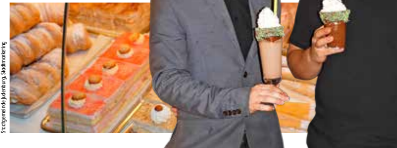
Stadtgemeinde Judenburg, Stadtmarketing

Hauptplatz 3 office@cafejudenburg.com Mo.–Mi. & Fr.–Sa. 7.30–18 Uhr So. 9–17 Uhr