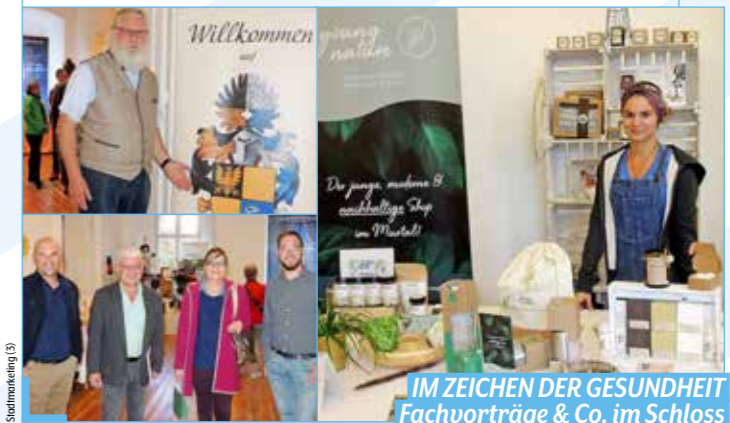
IM ZEICHEN DER GESUNDHEIT Fachvorträge & Co. im Schloss

Kernthemen: gesundes Essen, gesunder Schlaf & Nahrungsergänzung.