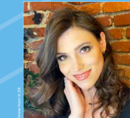
Was für ein Augenaufschlag! Die Magnetwimpern von Lashes View sorgen für Volumen.

Lashes View Gußstahlwerkstraße 28 T. 0676 722 66 12, 0664 41 01 819 & 0664 11 09 100 info@lashesview.com, https://shop.lashesview.com Öffnungszeiten: Mo.–Do. 9–16 Uhr, Fr. 9–12 Uhr