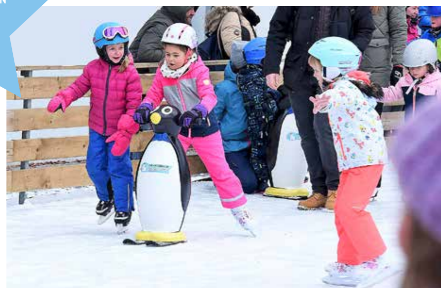
Für Anfänger warten am Eislaufplatz Pinguine als lustige Lernhilfen.

DAHIN GEHT'S! Der Judenburger Eiszauber hat heuer fast drei Monate offen. Feines Eislaufvergnügen mitten in der Stadt – dahingleiten und Spaß haben!