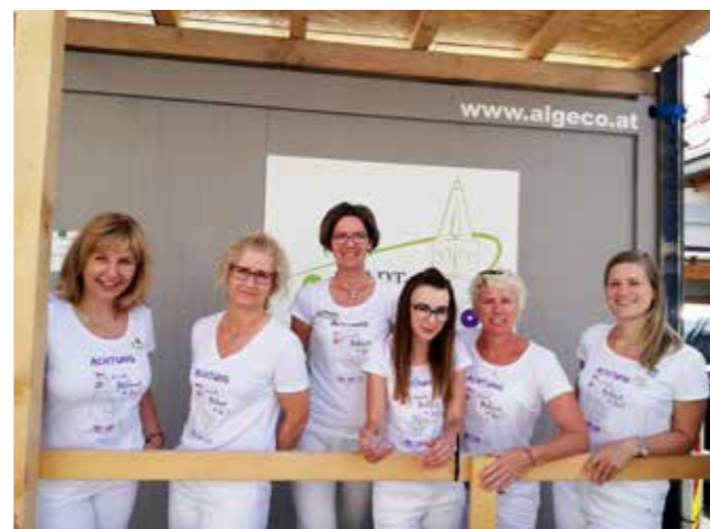
Ungestörter Verkauf trotz Umbau fand im gegenüberliegenden Apotheken-Container statt.

Alle Stückerl spielt übrigens auch die neu gestaltete Apotheken-Fassade aus eingefärbtem Emailglas. Seit Mitte September gibt's zum 50. Geburtstag moderne Apotheken-Kompetenz in den dazu passenden Räumlichkeiten.