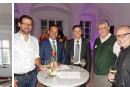
Mit steirischen Schmankerln und niederösterreichischem Wein wurden die Besucher des 1. Schlossgesprächs verköstigt.