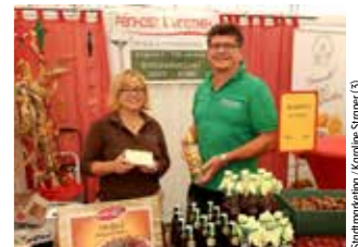
Feinkost Leitner & Mitterbacher sorgen für den Genuss bei der Messe.