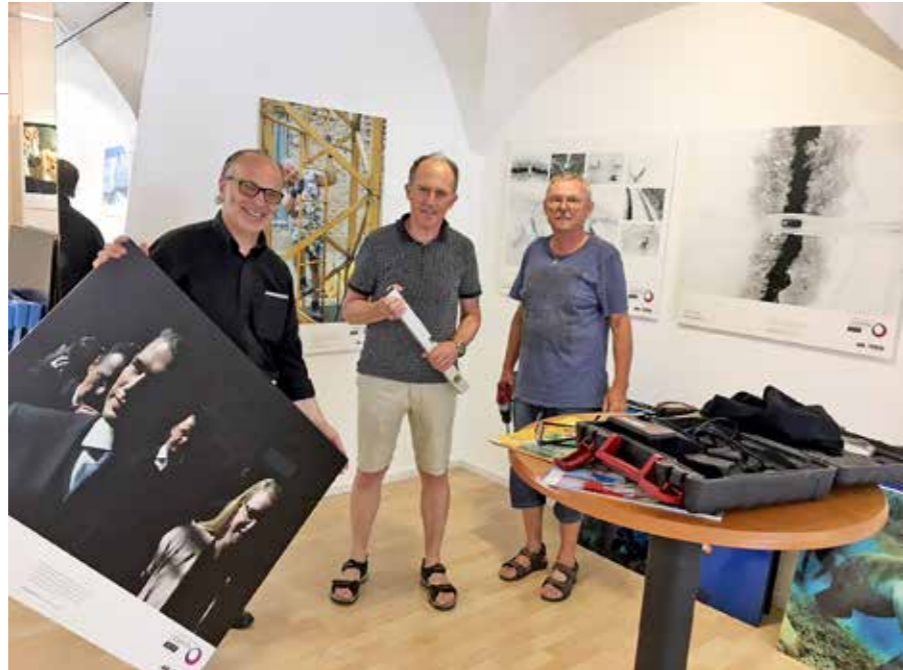
Die PhotowerkSTADT: Bühne für Hobby- und Berufsfotografen.

ÖFFNUNGSZEITEN Donnerstag 15 bis 18 Uhr Freitag & Samstag 10 bis 12 Uhr