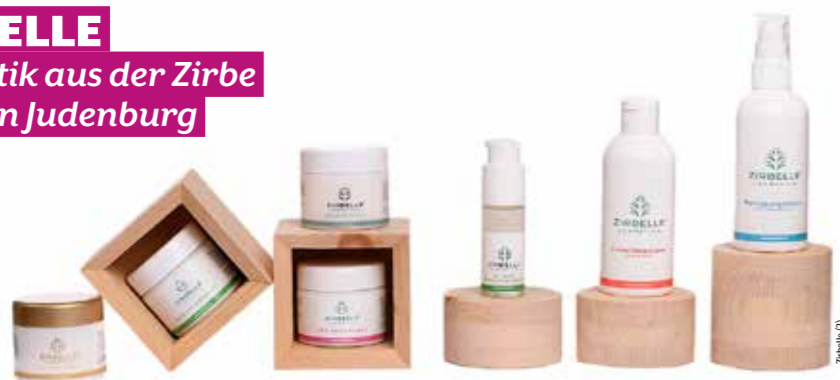
Gesichtswasser, Reinigungsmilch, Peeling, Maske, Elixir, Feuchtigkeit- und Anti-Aging-Creme aus ätherischem Zirbenöl – samt und sonders in der Landschaftsapotheke Judenburg exklusiv entwickelt.