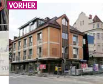
IN NEUEM GLANZ: Nicht nur die Innenräume der Stadt-Apotheke wurden komplett umgestaltet, auch die Fassade funktelt dank neuem Anstrich.