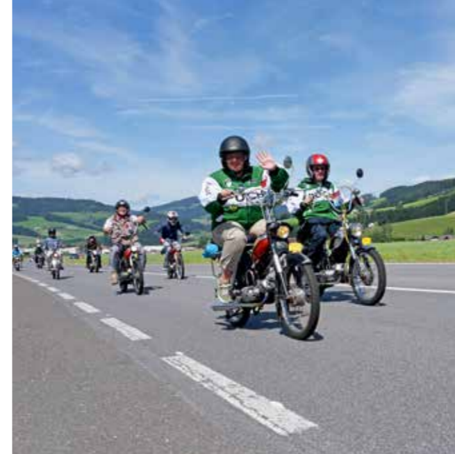
Puch-Fans aus aller Herren Lande treffen sich alle Jahre wieder bei der Puch Parade zur gemeinsamen Ausfahrt im und rund ums Murtal.