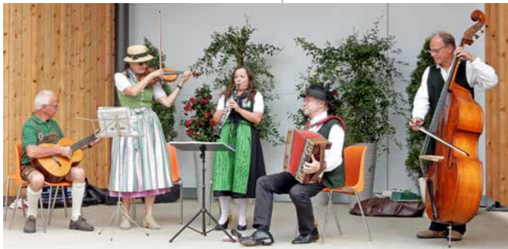
Die neue Tonanlage der Zirbenlandbühne sorgt für feine Klänge.

Egal, ob bei Beach findet Stadt, Heimatsommer, Europawahl, Handwerksmarkt, Maibaumaufstellen oder Toskanafest – Musik und Ton kam von der Zirbenlandbühne am Hauptplatz. Zusätzlich ist der Holz-Glas-Pavillon wind- und wetterfest und kann von allen Bürgern sowie von Schulen und Vereinen genutzt werden.