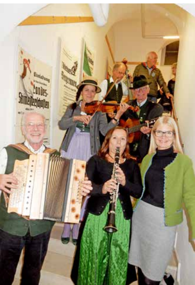
Die bunte Kulturwelt Judenburgs entdecken – am besten im Rahmen der Langen Nacht der Museen am 5. Oktober.

BEREITS ZUM 20. MAL INITIIERT DER ORF HEUER DIE LANGE NACHT DER MUSEEN. MIT DABEI IN JUDENBURG: PUCH MUSEUM, STADTMUSEUM UND DAS MUSEUM MURTAL.