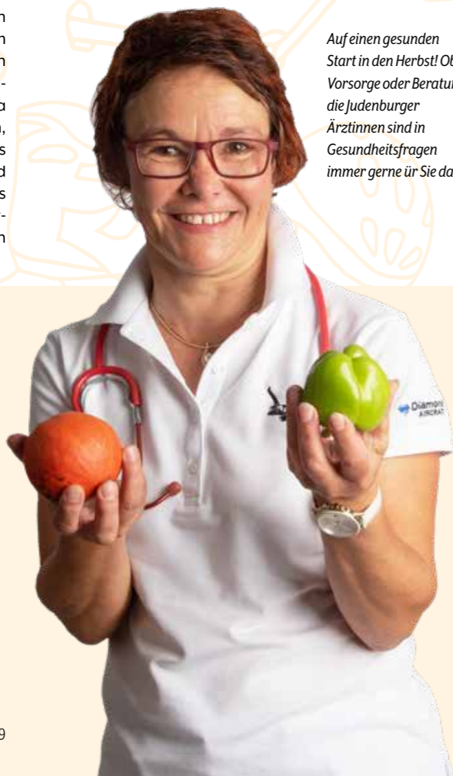
Auf einen gesunden Start in den Herbst! Ob Vorsorge oder Beratung – die Judenburger Ärztinnen sind in Gesundheitsfragen immer gerne für Sie da.