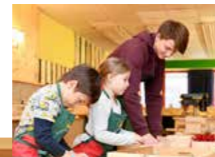
In der HolzwerkSTADT wird spielerisch mit Holz gearbeitet.

Leerflächenbelebung mit Schauhandwerk, Kunst- und Kulturinterventionen im öffentlichen Raum und eine vielseitig einsetzbare Bühne am Hauptplatz stehen auf der Agenda des vom EFRE (Europäischer Fonds für regionale Entwicklung) geförderten Projektes „Innenstadtgestaltung Judenburg“. Das Ziel: Die Stadt lebenswerter und attraktiver machen. Ganz konkret passiert das in Judenburg mit der PhotowerkSTADT in der Burggasse, der HolzwerkSTADT in der Kaserngasse und der Zirbenlandbühne am Hauptplatz – Projekte, die beständig weiterentwickelt werden.