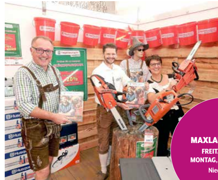
Mit dabei am Maxlaunmarkt: Das Hagebau-Murtal-Team mit Tipps für Bauen und Wohnen.

VON 11. BIS 14. 10. RUFT NIEDERWÖLZ ZUR GRÖSSTEN MESSE FÜR LANDTECHNIK, BAUEN UND WOHNEN – MIT RIESIGEM VERGNÜGUNGSPARK UND BUNTEN KRÄMERSTÄNDEN.