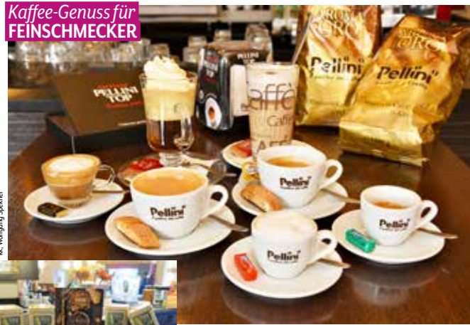
Kaffee-Genuss für FEINSCHMECKER