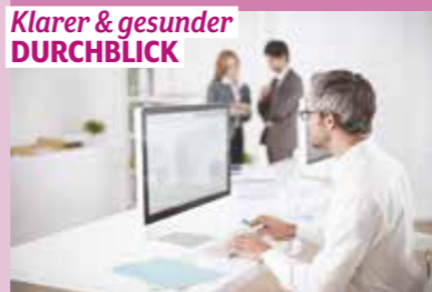
United Optics (2)