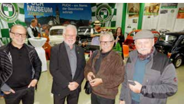
Im Fokus der Langen Nacht im Puch Museum: Der rüstige Puch Haflinger, der heuer seinen 60er feiert.

Rund 700 Museen und Galerien im ganzen Land öffnen ihre Pforten im Rahmen der „ORF Lange Nacht der Museen“ am 5. Oktober. Ein Ticket (regional oder österreichweit erhältlich) genügt, um in allen regionalen Häusern gutschauen zu können. So auch in Judenburg – etwa im Puch Museum, in dessen Mittelpunkt heuer – zu Ehren seines 60. Geburtstages – der Puch Haflinger steht. Neben Museumsführungen, Sondervorträgen und einer Buchpräsentation warten Rundfahrten mit dem kernigen Kultvehikel.