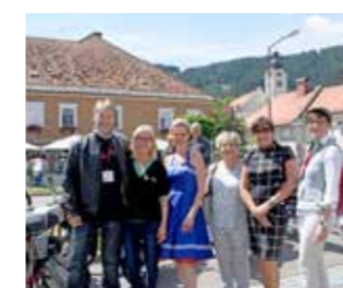
Strahlender Sonnenschein und lachende Gesichter: Das Rezept für ein gelungenes Event! Ob die Puch Parade nächstes Jahr noch größer wird? Wir werden sehen!