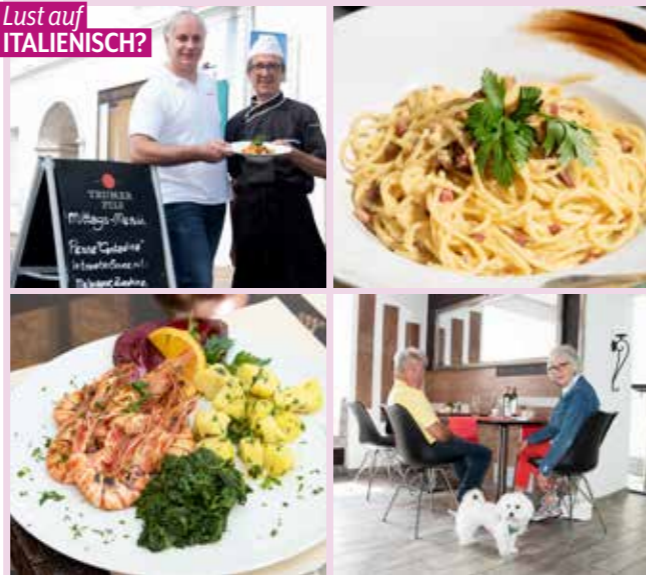
Lust auf ITALIENISCH?

Ristorante L'Opera Kaserngasse 25, Judenburg, Tel. 0664 5644015 https://lopera.jimdosite.com