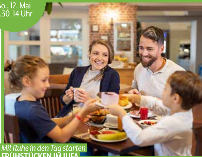
Mit Ruhe in den Tag starten FRÜHSTÜCKEN IM JUFA

MÜTTERTAGS- BUFFET So., 12. Mai 11.30-14 Uhr