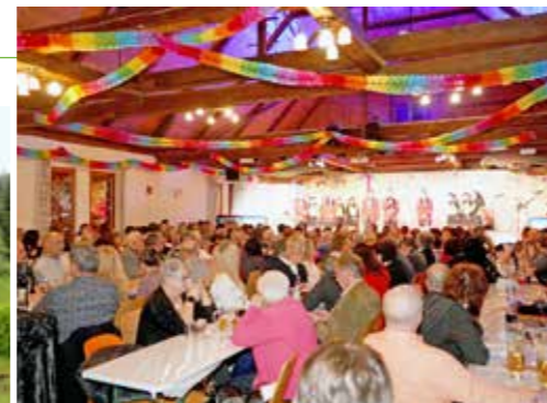
Faschingssitzung 2024, Stadtgemeinde