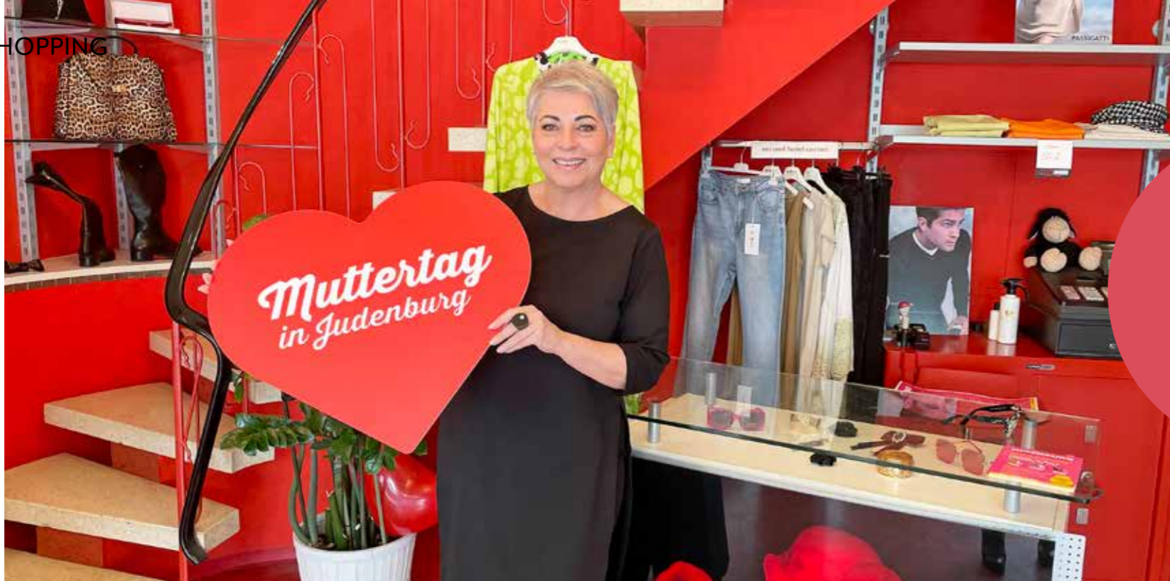
HERZLICHES MUTTERTAGS-SHOPPING: Die Judenburger Betriebe machen schöne Vormuttertagsgeschenke. Zu jedem Einkauf gibt es ein Los – es warten Hauptpreise und hunderte wertige Sachpreise, die Sie sofort abholen können!