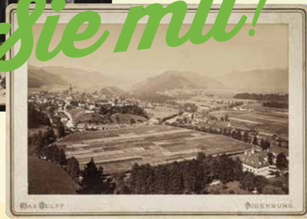
Eine Band in der Schlossergasse beim Stadtfest 1989. Und: Eine Postkarte von 1901 – Blick vom Liechtensteinberg auf die Stadt.