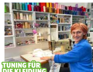
TUNING FÜR DIE KLEIDUNG

Murtal I Medienhaus & Druckerei Iris, Martiniplatz 1, Mo.-Do. 7-16, Fr. 8-12 Uhr