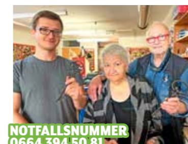
NOTFALLSNUMMER 0664 394 50 81