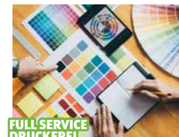
FULL SERVICE DRUCKEREI

Glaserei Ginter, Messerschmiedgasse 3, Mo.-Do. 8-12 & 14.30-17.30 Uhr