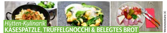
Hütten-Kulinarik KÄSESPÄTZLE, TRÜFFELGNOCCHI & BELEGTES BROT

Winterleitenhütte Ossach 45, Judenburg, T. 03578 82 10, Mi.-Mo. ab 10 Uhr, Di. Ruhetag Warme Küche ab 11.30 Uhr, www.winterleiten.com