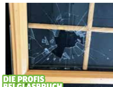
DIE PROFIS BEI GLASBRUCH

Diese Betriebe helfen maßgeschneidert weiter.