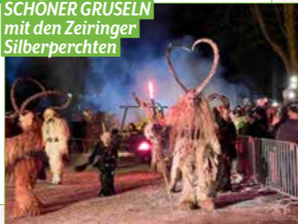
SCHÖNER GRUSELN mit den Zeiringer Silberperchten