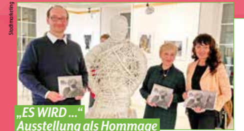
„ES WIRD ...“ Ausstellung als Hommage