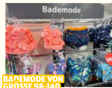
BADEMODE VON GROSSE 98-140

Naturstüberl, Burggasse 26, Mo.-Fr. 8.30-12 & 14.30-18 Uhr, Sa. 8.30-12 Uhr