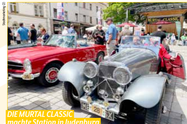
DIE MURTAL CLASSIC machte Station in Judenburg

Historische Motorräder und Autos konnten beim traditionellen Zeitstopp am Hauptplatz in aller Ruhe bestaunt werden.