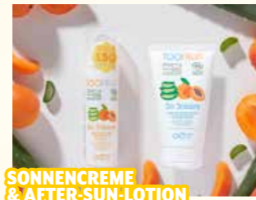
SONNENCREME & AFTER-SUN-LOTION

Die Sonnenprodukte von Too Fruit sind speziell für Kinder entwickelt. Ganz ohne Chemie, bio-zertifiziert.