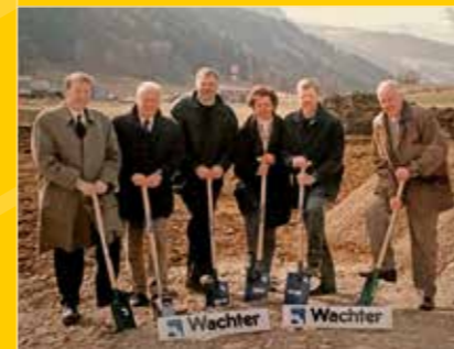
Spatenstich am 17. März 1999, knapp sechs Monate später wurde eröffnet. Heute beherbergt Werkzeug Wächter über 70.000 Artikel.

WERKZEUG WACHTER Grünhüblgasse 11, T. 03572 46 41, www.werkzeug-wachter.at Öffnungszeiten: Mo.–Fr. 8–18 Uhr