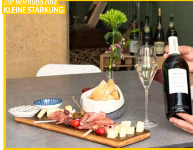
Zur Belegung eine KLEINE STÄRKUNG

Il Gelato Burggasse 4, T. 0676 95 30 603 im Sommer täglich von 8–20 Uhr