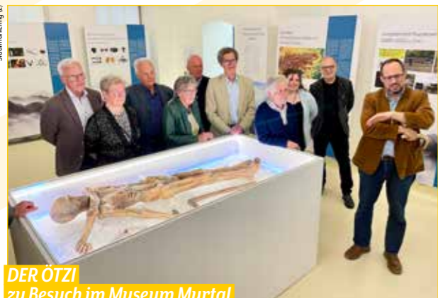
DER ÖTZI zu Besuch im Museum Murtal

Die originalgetreue Nachbildung des Ötzi ist Teil der aktuellen Sonderausstellung im Museum Murtal.