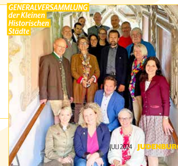
GENERALVERSAMMLUNG der Kleinen Historischen Städte

Historisches Flair, wunderbare Langsamkeit und Kulinarik sind Kernthemen der KHS.