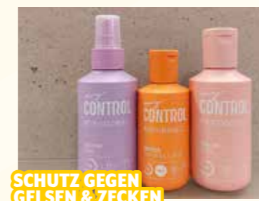
SCHUTZ GEGEN GELSEN & ZECKEN

NKD, Burggasse 8, Mo.-Fr. 8.30-18, Sa. 8.30-12.30 Uhr