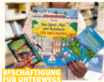
BESCHÄFTIGUNG FÜR UNTERWEGS

bio, chic & fair, Hauptplatz 18, Mo.-Fr. 9-12.30 & 14.30-18 Uhr, Sa. 9-12 Uhr