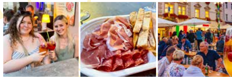
An drei Freitagen im August: Sommervibes und Genussmarkt am Hauptplatz. Nach 21 Uhr geht die Party im Arkadenhof und im Rathaus-Innenhof weiter.

SUMMERVIBES, GENUSSMARKT, BRAUCHTUM: DAS KÖNNEN DER JULI UND AUGUST IN JUDENBURG.