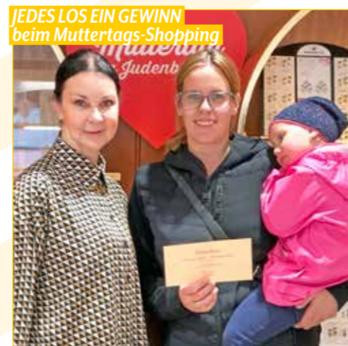
JEDES LOS EIN GEWINN beim Muttertags-Shopping