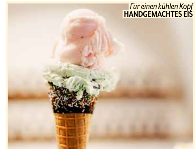
Für einen kühlen Kopf HANDGEMACHTES EIS