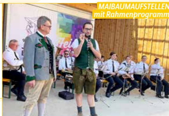
Neben dem Logo der Lustigen Steirer Judenburg montierten die „Trachtler“ auch eine Jubiläumstafel „950 Jahre Judenburg“ auf der Zirbenland-Bühne am Hauptplatz.

In bewährter Manier organisierten die Lustigen Steirer Judenburg das Maibaumaufstellen am 30. April. Neben Aufführungen der Kinderanzuggruppe und der Plattler, musikalisch begleitet von Sigi und seiner steirischen Harmonika, sorgte die AMV Stadtkapelle Judenburg für Unterhaltung. Der Brauchtumsverein servierte natürlich auch Speis und Trank, passend dazu gab es strahlenden Sonnenschein.