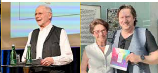
Spannende Vorträge zu Judenburgs Geschichte – nachzulesen unter anderem in der Jubiläumsschrift.