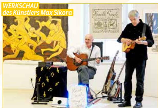
WERKSCHAU des Künstlers Max Sikora