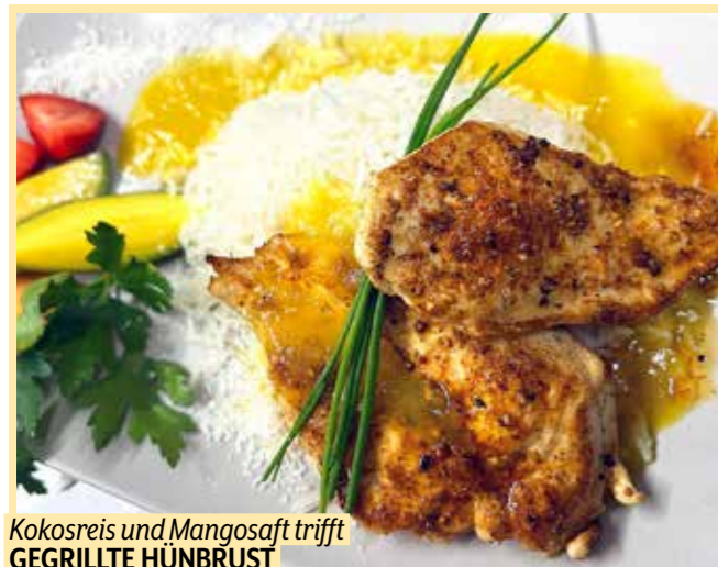
Kokosreis und Mangosaft trifft GEGRILLTE HÜNBRUST