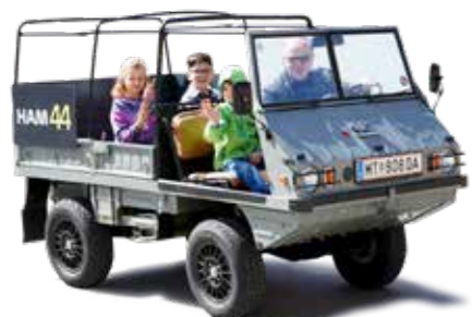
Lustig war's: Rundfahrten mit dem Haflinger am Eröffnungswochenende.