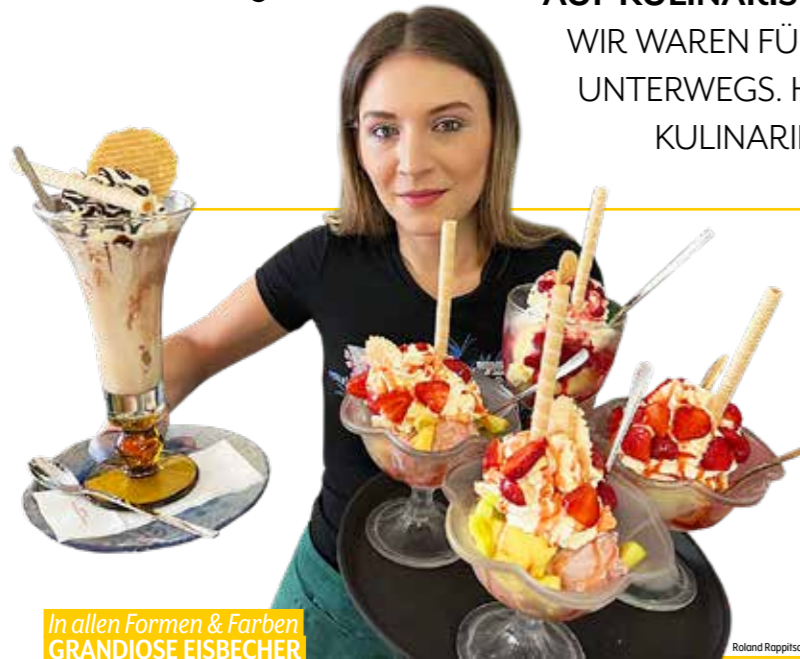
In allen Formen & Farben GRANDIOSE EISBECHER

AUF KULINARISCHER MISSION IN JUDENBURG. WIR WAREN FÜR SIE IN SACHEN GESCHMACK UNTERWEGS. HIER SIND UNSERE TIPPS FÜR IHREN KULINARIK-SOMMER IN DER STADT.