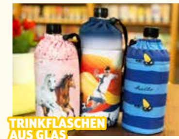
TRINKFLASCHEN AUS GLAS

Morawa Judenburg, Burggasse 10, Mo.-Fr. 8.30-18, Sa. 8.30-12.30 Uhr