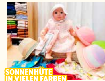
SONNENHÜTE IN VIELEN FARBEN

Beauty Room, Burggasse 30, Mo.-Fr. 8-17 Uhr gegen Terminvereinbarung