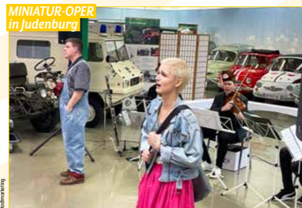
MINIATUR-OPER in Judenburg