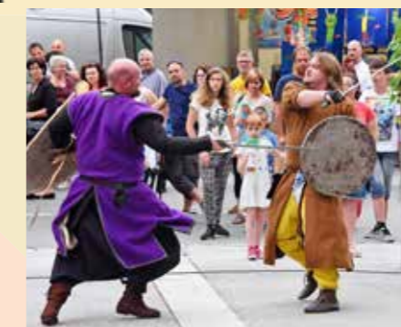
Plattler, Turnierkämpfe, Konzerte am Stadtfest – parallel dazu findet das Ritterfest am Zirkusplatz statt.

SAMSTAG | 6. JULI ab 10 Uhr SONNTAG | 7. JULI ab 10 Uhr ZIRKUSPLATZ JUDENBURG BENEFIZ-RITTERFEST Samstag Vormittag: Turnierkämpfe Nachmittag: Lagerleben & Mittelalterstände Abend: Feuershow um 21.30 Uhr Sonntag: Mittelalterfest mit Rittern, Marktleuten, Handwerkern, Musikern