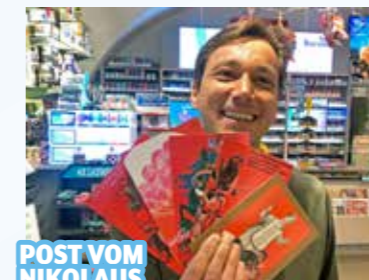
POST VOM NIKOLAUS

Naturstüberl, Burggasse 26, Mo.–Fr. 8.30–12 & 14.30–18 Uhr, Sa. 8.30–12 Uhr