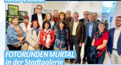
FOTORUNDEN MURTAL in der Stadtgalerie