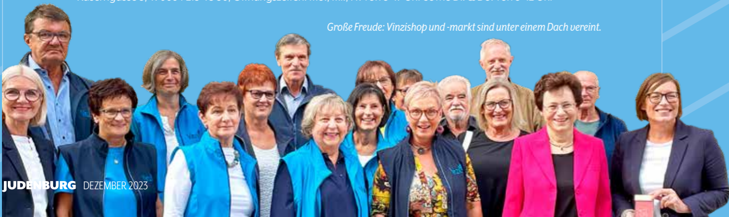
Große Freude: Vinzishop und -markt sind unter einem Dach vereint.

Kaserngasse 5, T. 0664 213 48 30, Öffnungszeiten: Mo., Mi., Fr. von 9–17 Uhr sowie Di. & Do. von 9–12 Uhr