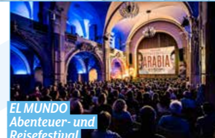
EL MUNDO Abenteuer- und Reisefestival!