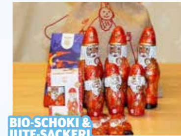
BIO-SCHOKI & JUTE-SACKERL

A-Preis, EKZ-Eurospar, Frauengasse 2, Mo.–Fr. 8.30–18.30 Uhr, Sa. 8.30–13 Uhr