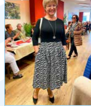
Mode von La Bella im Tee-Café Steinkellner.