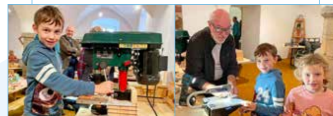
In der Holzwerkstatt lernen Kinder unter Anleitung spielerisch den Werkstoff Holz kennen.

Zu Halloween lud die Holzwerkstatt mARTini am Martiniplatz in die neu gestalteten wunderschönen Räumlichkeiten im restaurierten Gewölbe. Kinder ab vier bastelten unter Anleitung Schönes aus Holz. Im Advent gibt es wieder vier Basteltermine (Näheres auf S. 7). Wer keine Zeit hat: Die Holzwerkstatt ist für ein betreutes (Groß)Eltern-Kind-Basteln oder einen besonderen Kindergeburtstag auch individuell zu mieten.