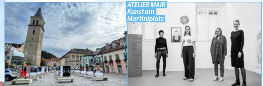
ATELIER MAIR Kunst am Martiniplatz

Immer im Oktober verwandeln Fotografen und Künstler mit hochkarätigen Bildern in- und outdoor die öffentlichen Plätze Judenburgs. Ein Hoch auf den Photomonat!