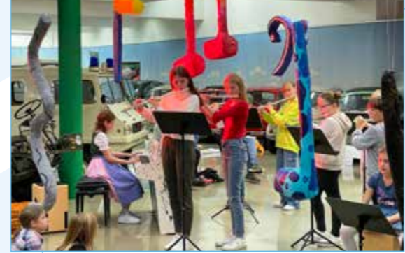
Schüler der Ulrich-von-Liechtenstein-Musikschule luden zum Mitmach-Musical ins Puch Museum.