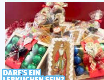
DARF'S EIN LEBKUCHEN SEIN?

Feinkost Leitner & Mitterbacher, Burggasse 5, Mo.–Fr. 8–12.30 & 15–18 Uhr, Sa. 8–12.30 Uhr