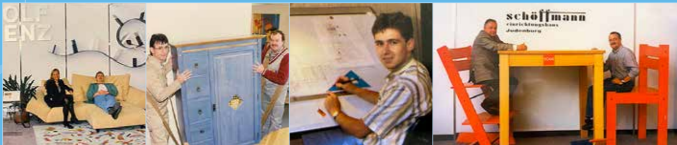
Detailverliebte Einrichtungs-lösungen für alle Wohnbereiche: Beratung, Planung und Montage kommen aus einer Hand.