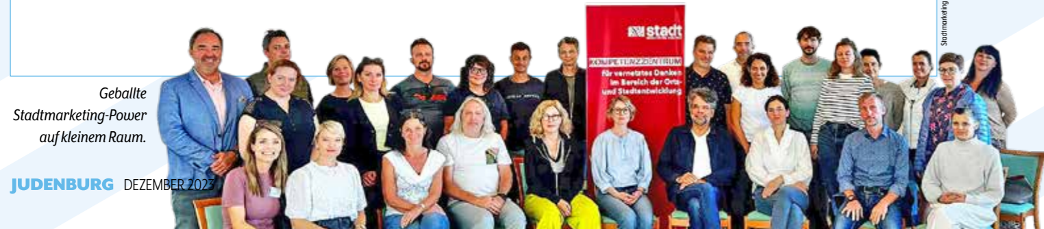
Geballte Stadtmarketing-Power auf kleinem Raum.