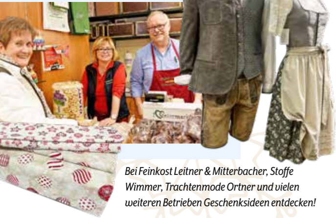
Bei Feinkost Leitner & Mitterbacher, Stoffe Wimmer, Trachtenmode Ortner und vielen weiteren Betrieben Geschenksideen entdecken!

DIE PUNSCH- UND GLÜHWEINHÜTTEN HABEN JEWEILS 1 STUNDE LÄNGER GEÖFFNET.