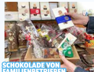
SCHOKOLADE VON FAMILIENBETRIEBEN

bio, chic & fair, Hauptplatz 18, Mo.–Fr. 9–12.30 & 14.30–18 Uhr, Sa. 9–12 Uhr