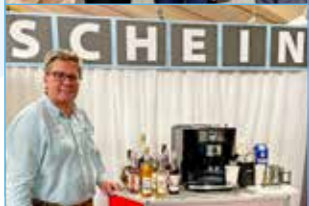
AINOVA mit Judenburgerstraße