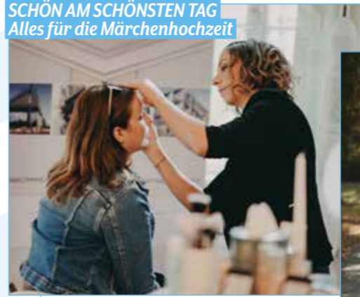
Ja, ich will: Das Schloss Liechtenstein bot für die Hochzeitsmesse den passenden Rahmen.