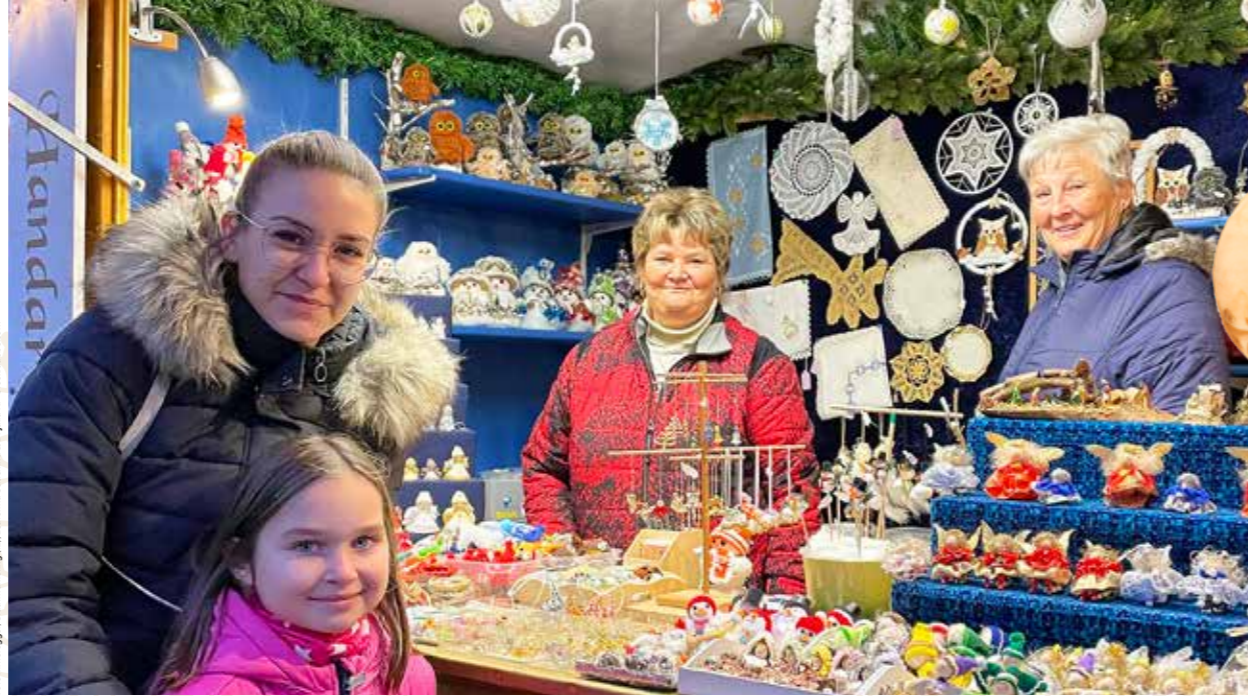
Vom stimmungsvollen Christkindlmarkt in die hell erleuchtete Stadt – Adventgenuss und Einkaufsfreuden in Judenburg.

SHOPPING-TIPPS TÄGLICH AB 1. DEZEMBER AUF FACEBOOK & INSTAGRAM JUDENBURG.MURTAL