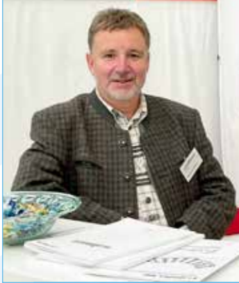
Der Lattoflex-Effekt: Viel lassen sich vermeiden.