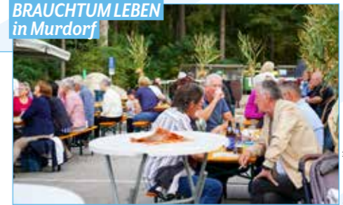
Gute Stimmung beim Herbstfest.