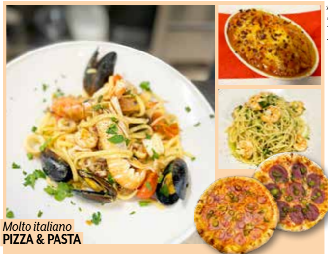
Molto italiano PIZZA & PASTA