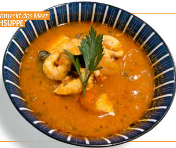
So schmeckt das Meer FISCHSUPPE

WENN'S SCHMECKT ... KENNEN SIE DAS, WENN MAN DEN TELLER AM LIEBSTEN NOCH SAUBER SCHLECKEN MÖCHTE? WIR SCHON. HIER SIND SIE, UNSERE TIPPS FÜR FOODIES IN JUDENBURG.