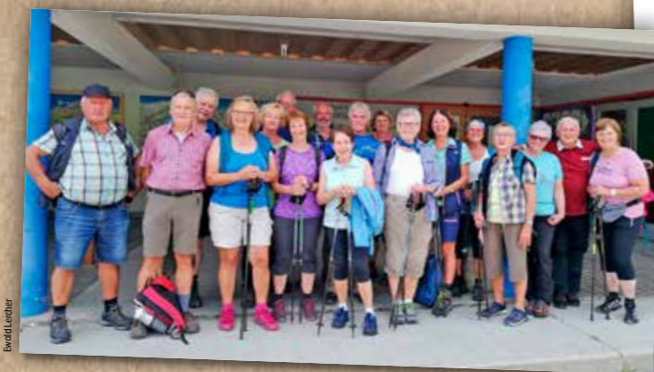
Altern mit Zukunft – wie das geht, zeigt diese Judenburger Wandergruppe.