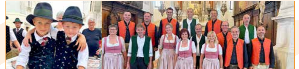
Steirische Lebensfreude in Piran – auf Plätzen, in Galerien, Kirchen und Cafés.

Schon seit vielen Jahren gibt es mit der Stadt Piran einen kulturellen Austausch mit gegenseitigen Auftritten von Chören und Kunst-Ausstellungen. An drei Tagen präsentierten sich die Städte heuer von 15. bis 17. September gemeinsam mit dem örtlichen Verein Georgios Piran am berühmten Tartini-Platz, der Galerie Apollonio, bei einer Schifffahrt mit internationalen Chören, in Cafés auf öffentlichen Plätzen und bei einem Festgottesdienst. Mit im Gepäck: die Plattler der Lustigen Steirer Judenburg, das Doppelquartett Zirbenklang, die A-Capella-Gruppe Vocalix, Surfen am Brett.at plus Bilder der Künstlerinnen-Gruppe Aquart. Das jeweilige Stadtmarketing servierte dazu Mullbrat'l aus der Oststeiermark und Zirbenschnaps aus dem Murtal, Städte- und Region-Infos natürlich inklusive.