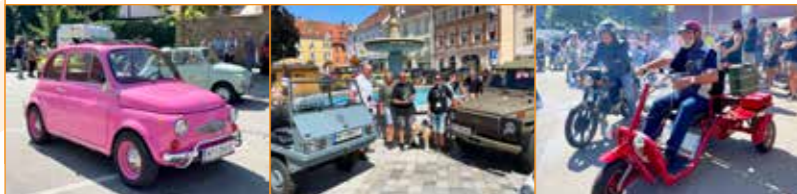
Rekordjahr 2022 nochmals übertrumpft: 2023 waren über 300 Teilnehmer mit dabei!

Die Oldtimer-Freunde gingen heuer wieder auf gemeinsame Sternfahrt. Von Judenburg über Fohnsdorf und Pöls nach Unterzeiring bis Möderbrugg. Zurück am Judenburger Hauptplatz wurde gegrillt. Dazu spielten die Stohli's. Schön war's!