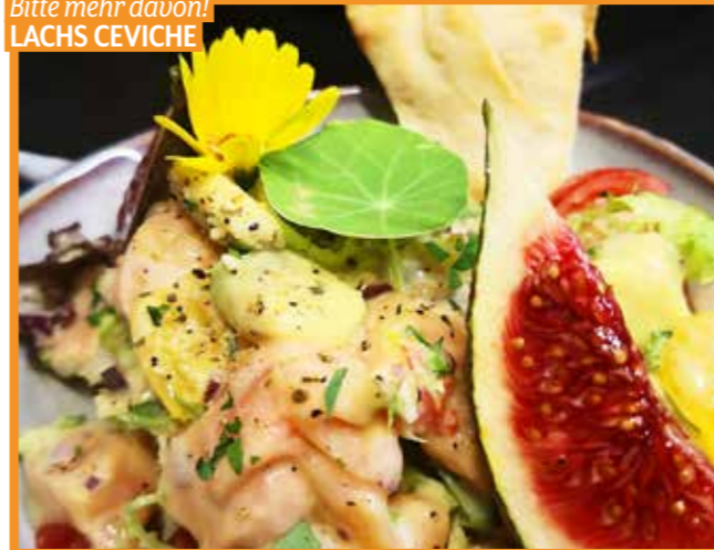
Bitte mehr davon! LACHS CEVICHE

Ristorante Da Franco Kaserngasse 47, T. 03572 47 487 Mi.–Sa. Fr. 11–14.30 & 17.30–23 Uhr, unbedingt reservieren!