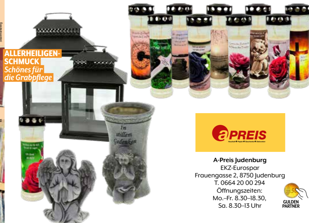
ALLERHEILIGEN-SCHMUCK Schönes für die Grabpflege

a-Preis im Shop neben dem Eurospar in der Frauengasse. Sie finden alles von der Laterne über Engel-figuren und herbstliche Kunstblumen bis hin zu Grablichtern mit schönen Motiven und Sprüchen.