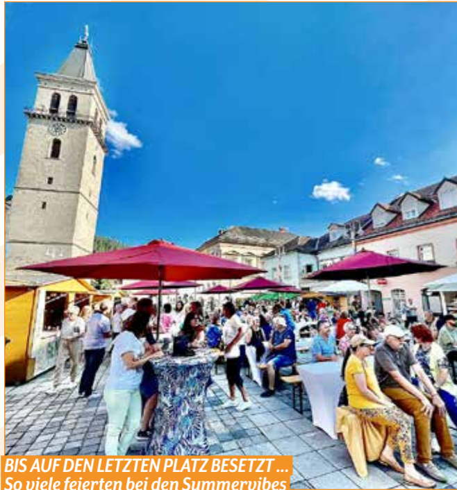
BIS AUF DEN LETZTEN PLATZ BESETZT ... So viele feierten bei den Sommervibes

DA WAR WAS LOS IM SOMMER IN JUDENBURG. DIE SCHÖNSTEN VERANSTALTUNGEN FÜR SIE IM RÜCKBLICK.