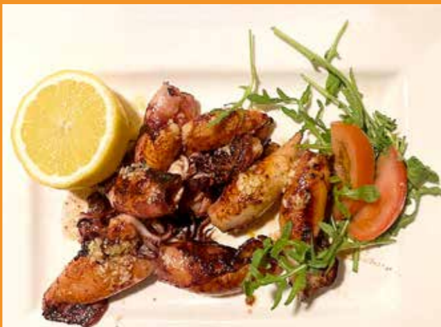
What else? CALAMARI

Pizzeria San Marco Weyergasse 1, T. 03572 422 00 Mo., Do., Fr. 11–14.30 & 17–22 Uhr, Sa. 11–22 Uhr, So. & Feiertag 11–21 Uhr