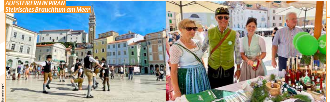
Die Städte Judenburg und Weiz brachten steirische Volkskultur nach Slowenien.