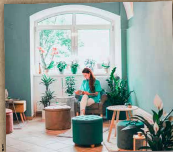
Die Community Nurses helfen den Judenburgern kostenlos in Gesundheitsfragen.

WAS DIE COMMUNITY NURSES FÜR IHRE GESUNDHEIT LEISTEN UND WIE SELBSTBESTIMMTES ALTERN FUNKTIONIERT.