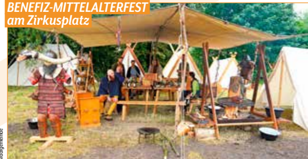
Der Reinerlös des Festes kommt einem guten Zweck zugute.