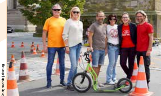
Die Stadtgemeinde Judenburg lud dazu ein, ein Fest rund um Verkehr und Mobilität zu feiern.