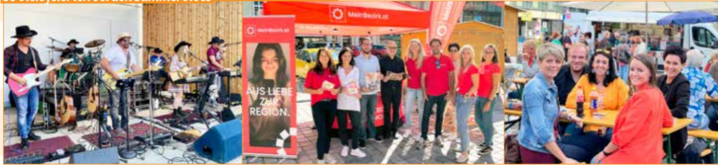
Voller Hauptplatz, lässiges Programm, gute Laune, gutes Essen, gute Getränke – das waren die Sommervibes 2023.

Kleiner Rückblick: Sommervibes samt Genussmarkt am Judenburger Hauptplatz an vier Freitagen im Sommer. Perfektes Sommerwetter bei der Country Night am 7. Juli mit Raccoon. Dazu Party in Schnuggi Bar, Ludwig & B3. Ein lauer Abend auch bei der italienischen Nacht am 11. August. Auf der Bühne: das italienische Duo „Cuore Italiano“, auf den Tellern: Pizza und bester Prosciutto, in den Gläsern sommerliche Spritz-Getränke. Zum Abschluss am 1. September spielte Ratschi, in der Schnuggi Bar wurde mit Rob Hirsch und Susanne Grill gefeiert. Weitere Specials: Woche-Bezirkstour und Präsentation des Almtals, der Region der Kleinen Historischen Partnerstadt Gmunden. Auch bei bestem Sommerwetter. Einziger Wetter-Wehmutstropfen: Der Auftakt am 23. Juni musste wetterbedingt abgebrochen werden, die Roaring Sixties konnten nur wenige Titel spielen – Fortsetzung folgt 2024, versprochen.