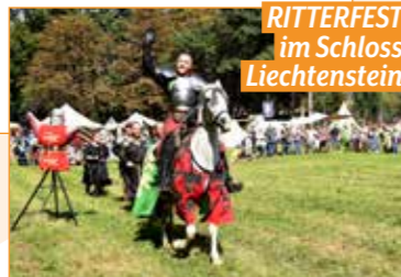
RITTERFEST im Schloss Liechtenstein

Fixsterne im Sommer: das Benefiz-Mittelalterfest des Vereins „Ritterschaft zu Judenburg“ am Zirkusplatz und das Ritterfest im Schloss Liechtenstein. Mit mittelalterlichem Lager, Ritterturnier, Schaukämpfen, Marktständen, Tanz, Musik und mehr.