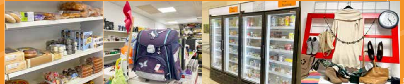
Gute Lebensmittel, Toilettartikel, Spielzeug, Kleidung, Geschirr – Vinzmarkt und Vinzishop decken die täglichen Bedürfnisse zu einem fairen Preis.

Öffnungszeiten: Mo., Mi., Fr. von 9–17 Uhr sowie Di. u. Do. von 9–12 Uhr