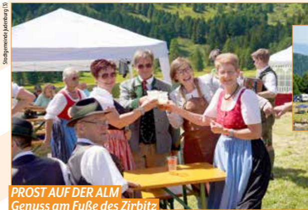
PROST AUF DER ALM Genuss am Fuße des Zirbitz