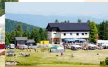
Musik, Tanz, Handwerk und Kulinarik beim Almkirtag auf der Winterleiten.