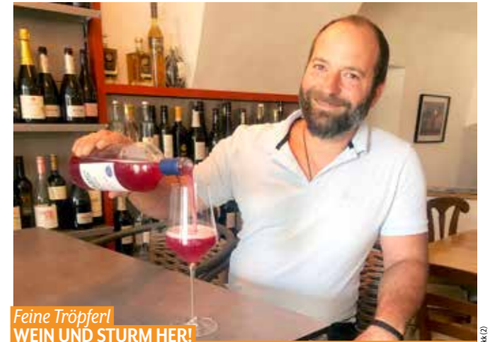
Feine Tröpfel WEIN UND STURM HER!

Restaurant Arkadia Arkadenhof/Burggasse 3, T. 03572 444 59 Mo., Di. & Fr. 11.30–14 Uhr & 17.30–21 Uhr, Sa. 11.30–21 Uhr, So. 11.30–17 Uhr www.restaurant-arkadia.at