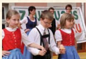
„Lustige Steirer Judenburg“

Judenburger Stadtfest 2011 – ein Fest für die ganze Familie bei freiem Eintritt!